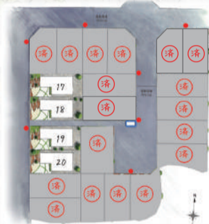
【土地価格表】 建築条件付宅地分譲